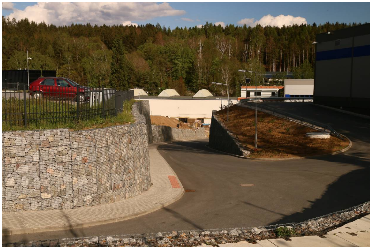
Foto č.5 – komunikace, která je součástí změny - 10.5.2019