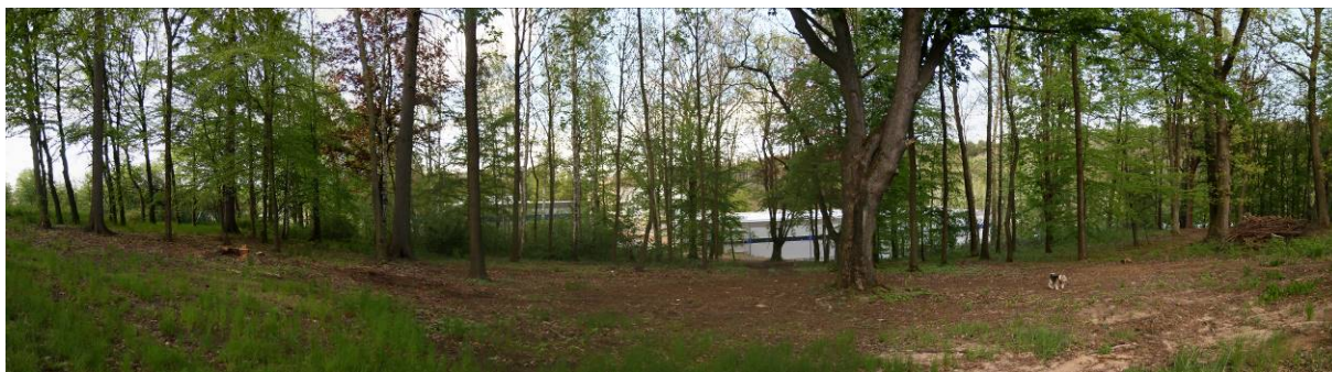
Foto č.7 – území zámeckého parku, na kterém je navrženo rozšíření průmyslové výroby - 10.5.2019