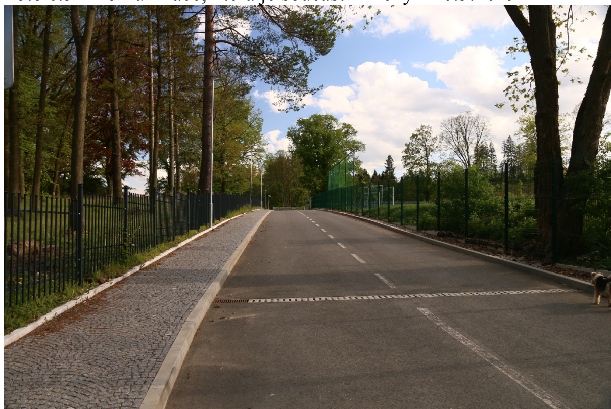
Foto č.6 – černá stavba komunikace, která je součástí změny - 10.5.2019