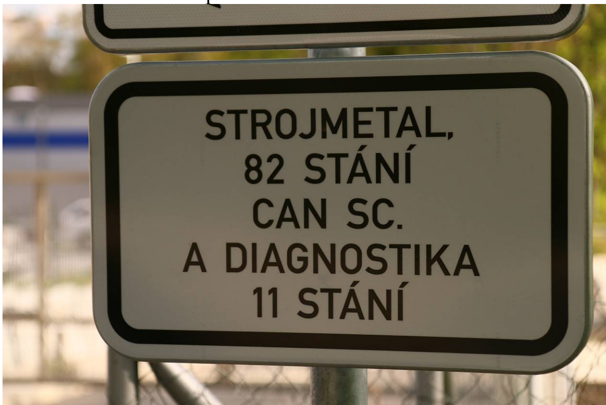
Foto č.2 – dopravní značení na parkovišti - 10.5.2019