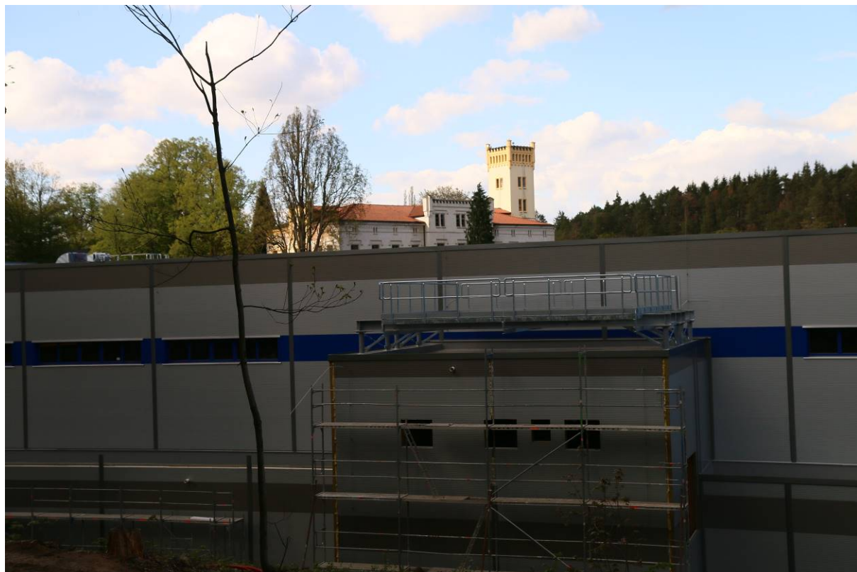
Foto č.10 – nová obrobna na parcele č.936 kú Těptín - 10.5.2019