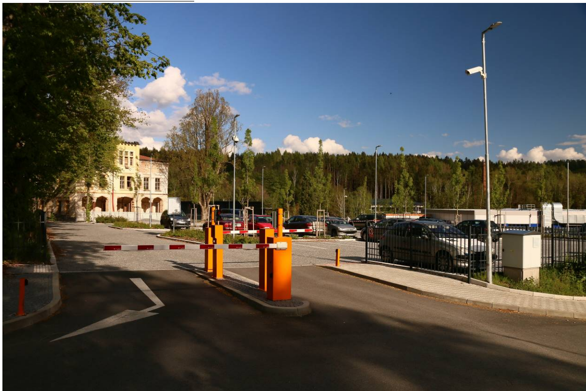
Foto č.1 – černá stavba parkoviště - 10.5.2019