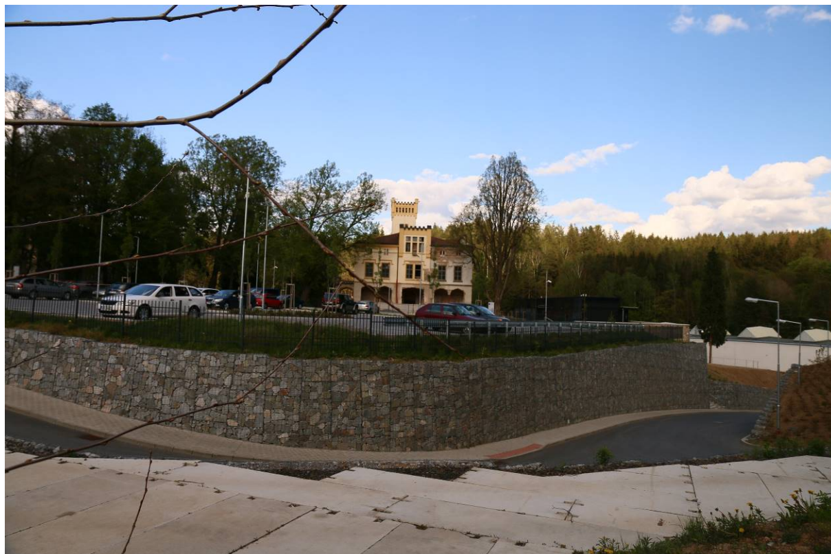
Foto č.3 – nová komunikace a černá stavba parkoviště - 10.5.2019