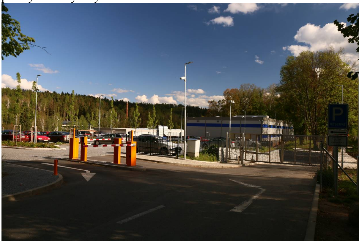
Foto č.9 – parkoviště a hala č.1 - 10.5.2019