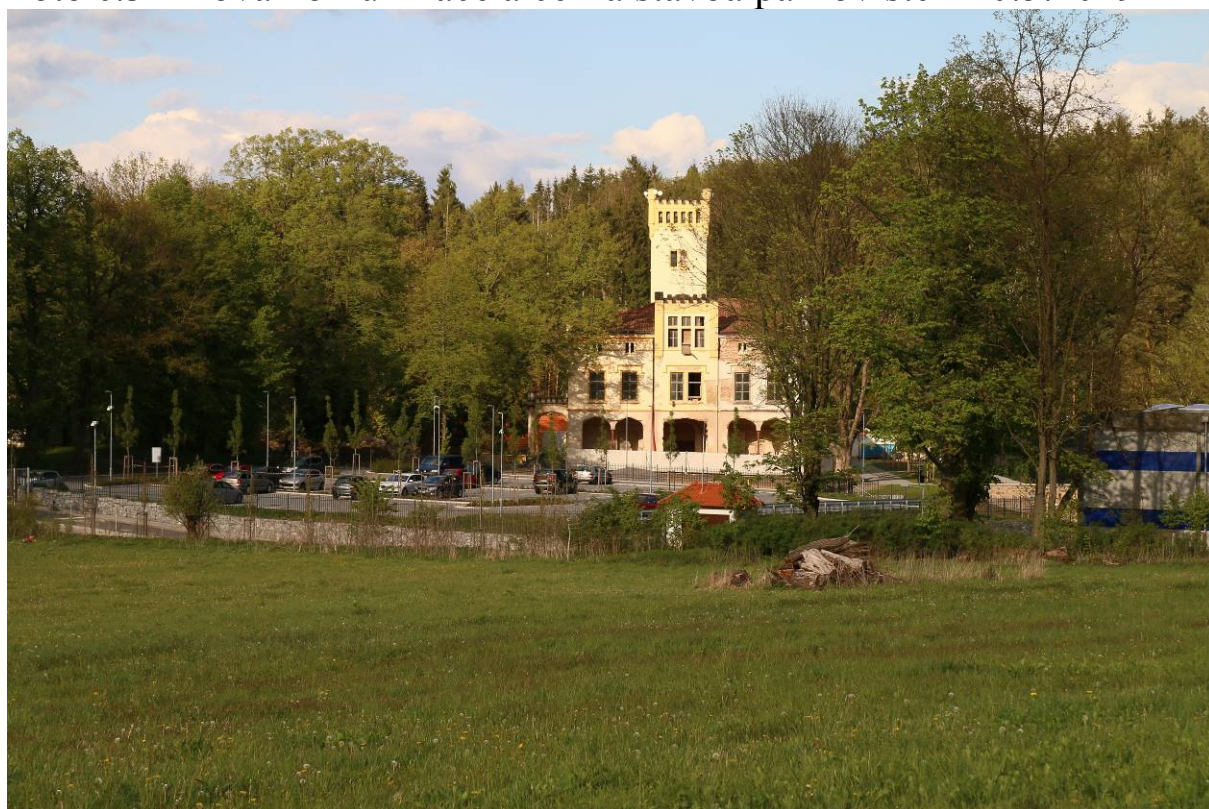
Foto č.4 – zásah do zámeckého parku - 10.5.2019